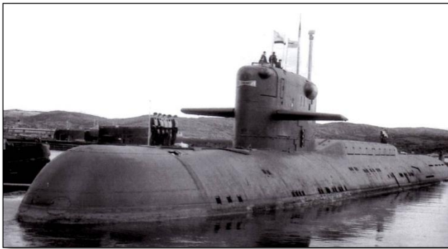
K-137 dans son port d'attache

Précédent la visite de L.I. Brejnev à Severodvinsk, le commandant en chef de la marine Sergei Georgievich Gorshkov et le secrétaire du Comité central du PCUS, (curateur) du complexe militaro-industriel Dmitry Fedorovich Ustinov sont montés à bord du K-137 (navire de tête 667A du projet, « Leninetz »).