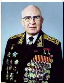
Sergei Georgievich Gorshkov