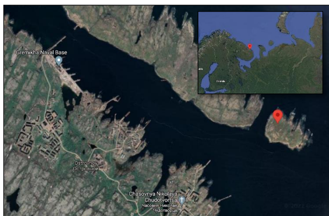
Base navale de Gremikha

Nous sommes en mai-juin 1967, et notre L.I. Brejnev visite Mourmansk et en profite pour se rendre sur toutes les bases navales de la flotte du Nord.