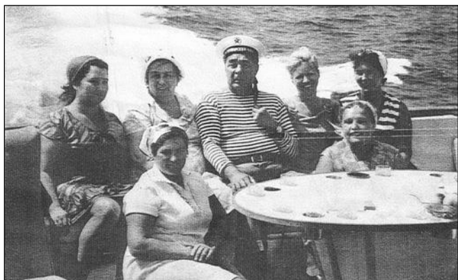
Pas de doléances particulières pour celles-ci !

Bien qu'il soit formellement interdit à toutes les épouses des marins de parler de problèmes, elles décident tout de même d'aborder le secrétaire général pour leur narrer leurs soucis quotidiens : que les journaux viennent une fois par semaine, que la télévision promise n'était toujours pas arrivée, qu'il y a une seule pièce dans les appartements et que le marin à son retour n'a aucun endroit pour se reposer quand il y a des enfants, que le verre de 3 mm des fenêtres ne résiste pas au vent, etc.